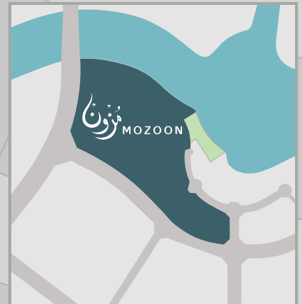
موقع مخطط مزون Mozoon Masterplan Location